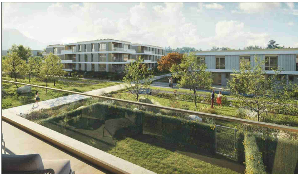
Des arbres, de l'eau et les montagnes en toile de fond.

Sur une surface de presque neuf hectares, un triptyque de bâtis composés d'îlots, de villas et d'une résidence seniors commence à prendre ses quartiers.